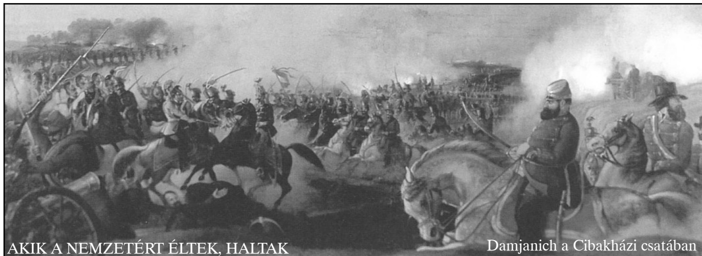
AKIK A NEMZETÉRT ÉLTEK, HALTAK

Erre tanít minket Széchenyi István és erre tanít minket az 1848-49-es forradalom és szabadságharc ünnepe.