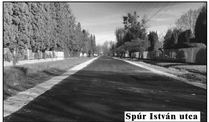
Spúr István utca