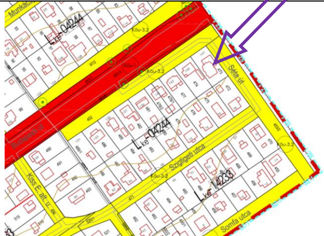
Módosítás előtti állapot (szab. terv):