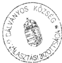
Domján Éva Helyi Választási Bizottság elnöke