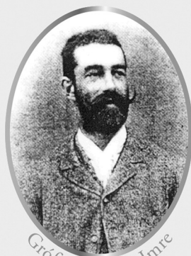
Gróf Széchenyi Imre